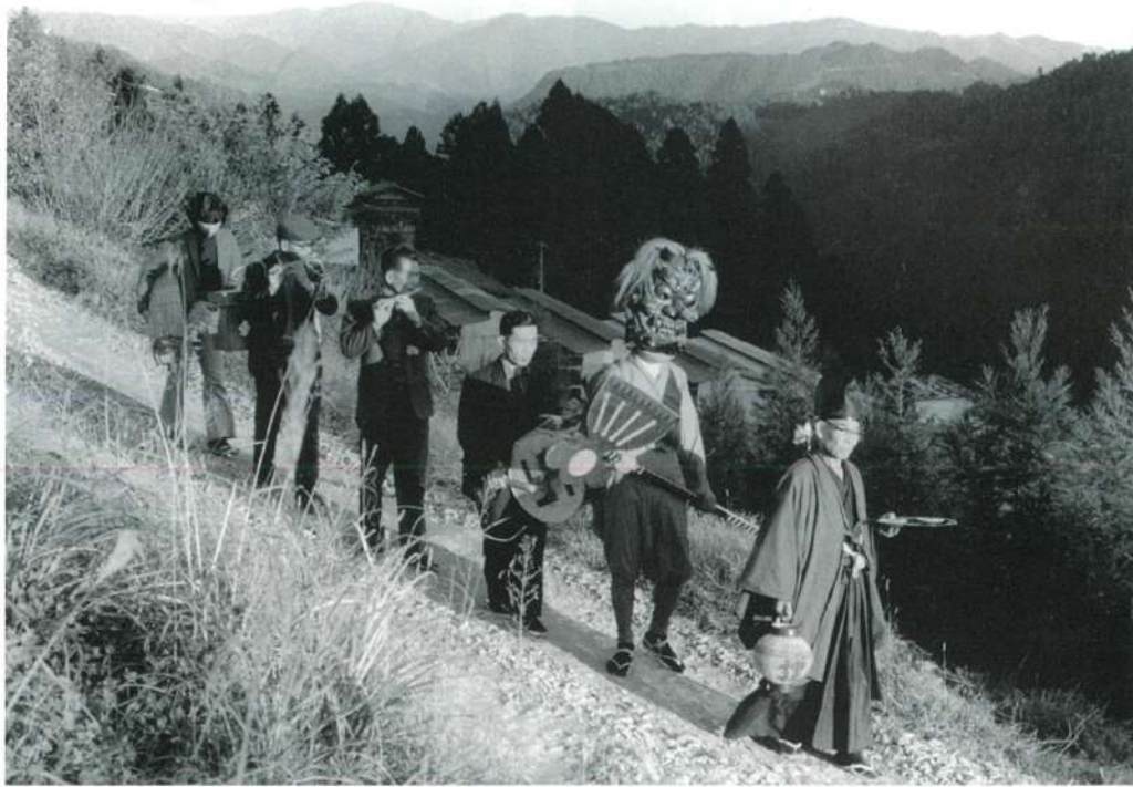
花祭 11月22日 愛知県東栄町月