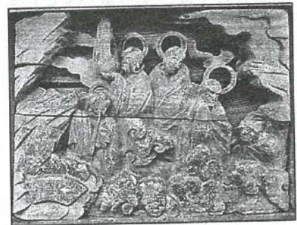
旧長福寺 81番大師堂・十六羅漢像