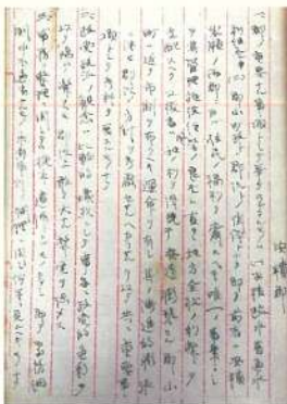
〔安積郡巡視復命書〕 〔明治・大正期の福島 県庁文書 1051〕

このうち、桑野村との合併は紆余曲折の末に頓挫するが(のち大正十四年に追加編入)、小原田村とは合意に達し、大正十三年九月一日に「郡山市」が誕生した。(山田英明)