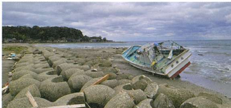
津波によって打ち上げられた漁船 珠洲市三崎町寺家にて2024.4.22