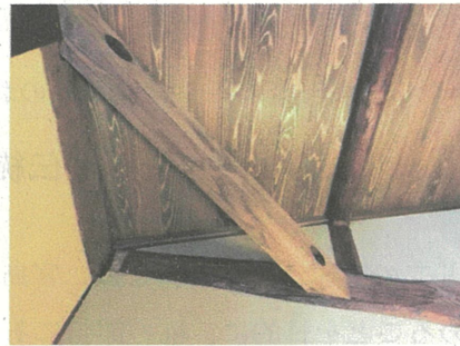
火打梁 (ひうちはり)

とを防ぐために縦方向、横方向の梁の間を、ちょうど直角三角形になるように組まれとる斜め方向の梁のことじゃ。1階の床の下部に設けるんが ひうちどだい 火打土台、2階などの床や小屋組に設けるもんを ひうちはり 火打梁つちゅうんじゃ。あと、この反対側の壁に