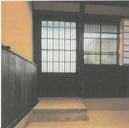
玄関内部で床面が道路より下がっている様子

建吉：まず、持ち送りの大きさじゃのう。ここの前面の道路は、昔より高さがずいぶん上がつとるんじゃ。こ