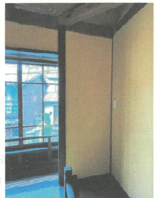
補強のため追加された壁

い場合があつてのう、こんなときは火打梁 ひうちはり が効かんけえ、構造用合板を使こうて補強をしとるんじゃ。この家もそうじゃが、木造の家は、柱や梁などの軸組で支えられとるんじゃ。これに構造用合板を入れることで壁つちゅう「面」の補強で横からの力に強い家になるんじゃ。構造用合板で造られた壁は横からの力には強いんじゃが、地震の揺れによる力は様々な方向からかかってくるんじゃ。じゃけえ今回は2階の和室の床や天井内に構造用合板でねじれに対しても補強しとるんじゃ。修理じゃあ、まず、外壁のモルタルや鉄板を取って、2階を跳ね出しにしたんじゃが、シロアリに喰われとったけえ、添柱を建てて内側にフレームをつくって支えとるんじゃ。こうやって伝建の修理で耐震補強をすることで、古い建物で生活する人が安心して住めるようになるんじゃ。じゃが、建物の状態や条件で補強するのに何がいいかは違うんじゃ。