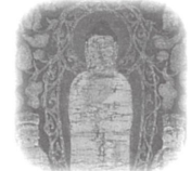
善光寺式阿弥陀三尊像(部分、高宮寺蔵)