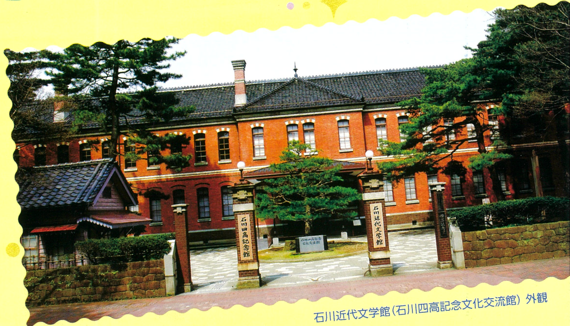
石川近代文学館(石川四高記念文化交流館) 外観