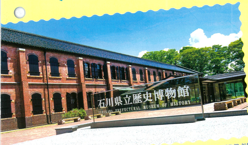
石川県立歴史博物館 外観