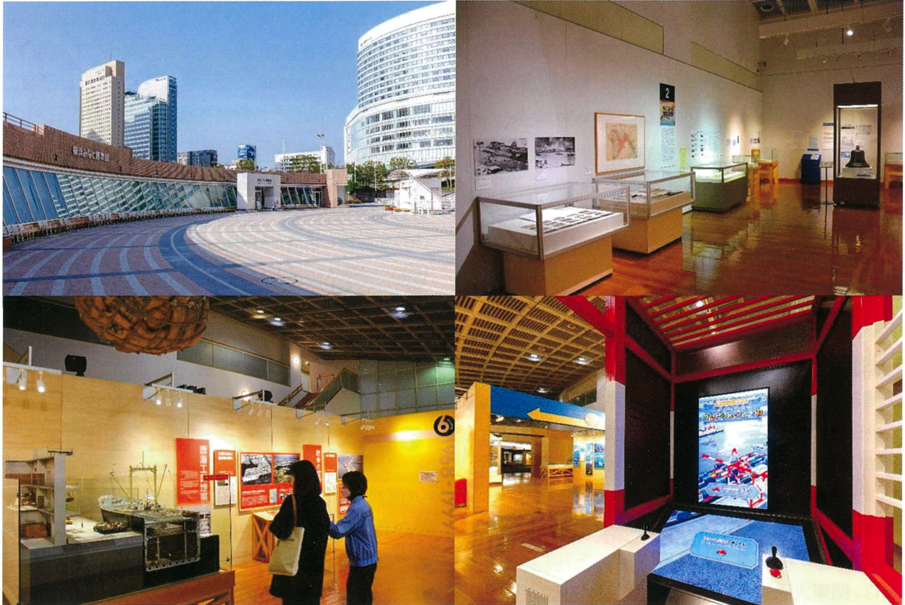
(左上) 横浜みなと博物館外観 / (右上) 企画展「関東大震災 100年 船と港から見た関東大震災」展示風景 (左下) 再開した展示案内ボランティアによる案内風景 / (右下) 新しく導入されたガントリークレーンシミュレーター