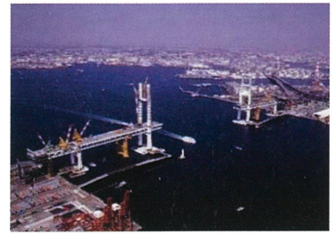
建設工事中の横浜ベイブリッジ 1988(昭和63)年

2024(令和6)年、横浜ベイブリッジは開通35周年、鶴見つばさ橋は開通30周年を迎えます。これを記念し、2つの橋の建設から今までの歴史を写真や映像、模型などで展示し紹介します