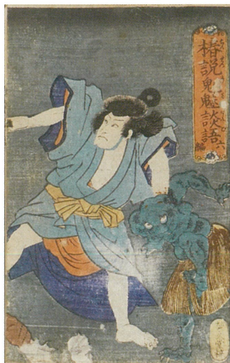
椿説鬼魅談語(ちんせつきみだんご) 安政6(1859)年[当館蔵]

展示では当館の収蔵資料の中から、江戸時代に刊行、筆写された本を紹介し、江戸時代に記され、読まれた本から当時の人びとの営みをひもときます。