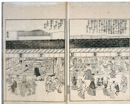
東海道名所図会(とうかいどうめいしよずえ) 寛政9(1797)年[当館蔵]