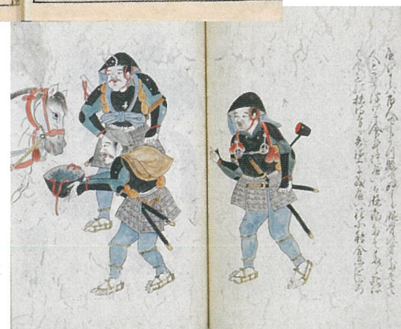
雑兵物語(ぞうひょうものがたり) 江戸時代[当館蔵]