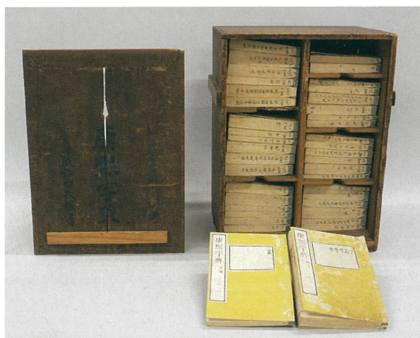
康熙字典(こうきじてん) 文久3(1863)年[当館蔵]

江戸時代は庶民も本を読むことができるようになった時代でした。それまで権力者のもとで行ってきた出版を江戸時代初期に民間で担い始めると、次第に庶民向けの本が出版されます。港区域でも芝神明町(現在の芝大門一丁目)などに書物問屋や地本問屋ができました。流通した本は多様で、文字を学ぶ教科書の役割をした本をはじめ、生活に必要な実用書や専門書、名所の案内書、大衆向けの小説などが刊行されました。また、入手が難しい本などは筆写され、写本で広まったものもあります。