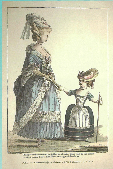
2. 「ギャルリー・デ・モード」 ル・クレール