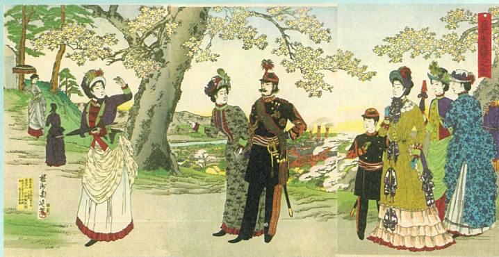
3. 「飛鳥園遊覧之図」 楊洲周延