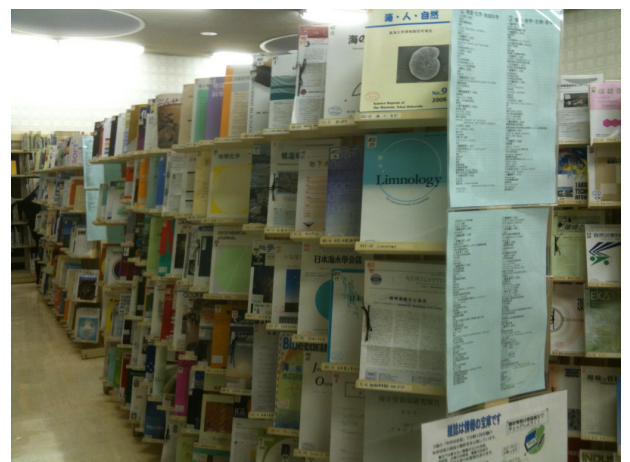
自然科学、工学、産業技術系を中心とした雑誌コーナー

社史コレクション、外国語科学技術雑誌デポジットライブラリー、ビジネス情報クイックコーナー……。それぞれ個性を放ちながら、一体化したサービスとして提供されている現場を拝見し、同図書館がビジネス支援図書館の先駆として評価されてきたことに納得しました。