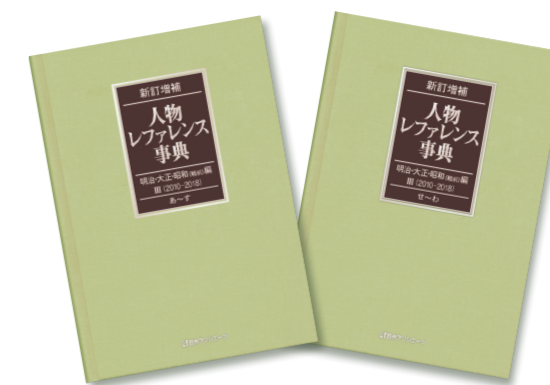
「新訂増補 人物レファレンス事典 明治・大正・昭和(戦前)編Ⅲ(2010-2018)」表紙